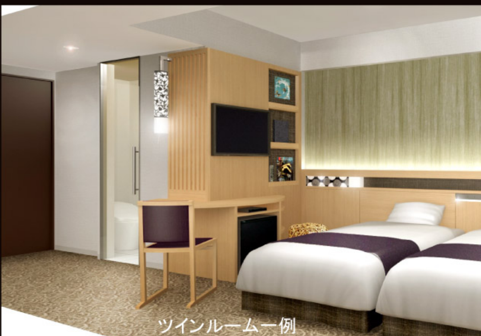
ツインルーム一例

液晶テレビ（32型）/ ハイクオリティーVODシステム / 電話 / 高速インターネット回線（無料） / 電気ケトル / 冷蔵庫 / ドライヤー（マイナスイオン） / 個別空調システム / 目覚まし機能付時計 / 洗浄機能付トイレ / お茶セット / 歯ブラシ / カミソリ / ヘアブラシ / シャンプー / コンディショナー / ボディーソープ / パジャマ / バスタオル / フェイスタオル / スリッパ / タンブラー / 洋服ブラシ