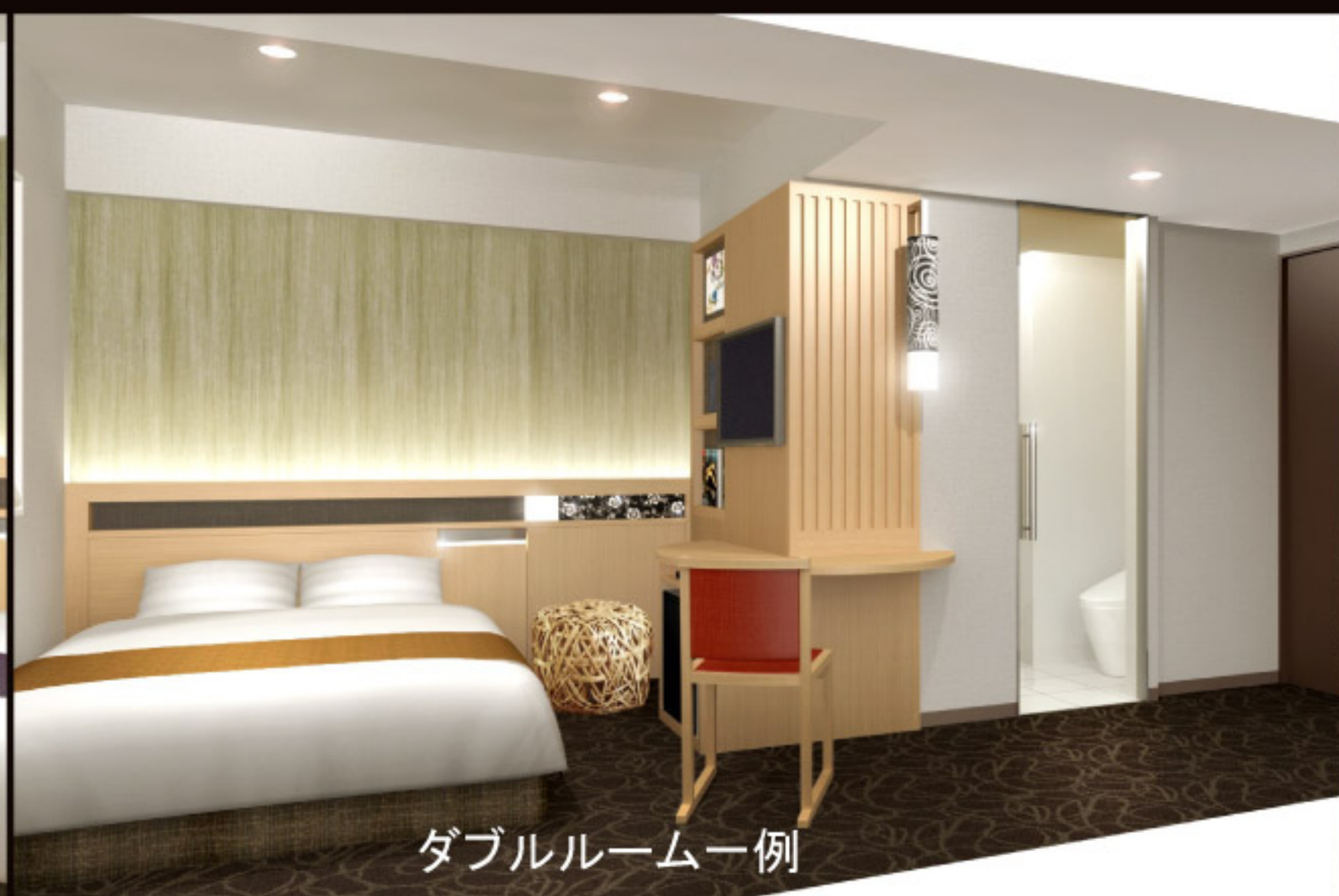
ダブルルーム一例